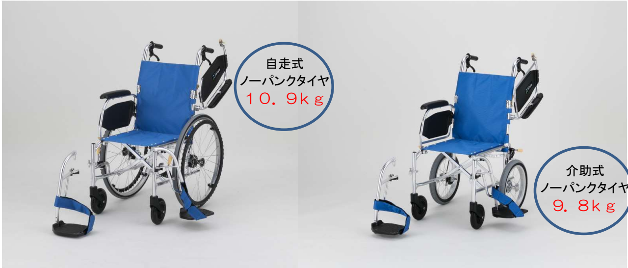
自走式 ノーパンクタイヤ 10.9kg